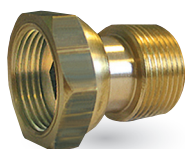
> Raccord écrou tournant prisonnier