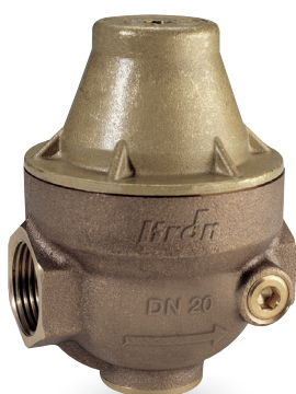
> Isobar+ sans raccord