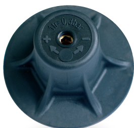
> Vis de réglage de la pression