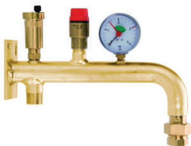
ECV acier complète